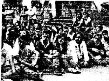
Colegio la roca